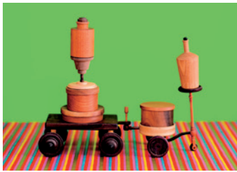
▲「滑車」collaboretion#1 Golondrina 展より

毎月発行しているクローズアップしもすわで、町内の企業を紹介しています。内容は各会社から提出いただいた原稿を基に掲載しています。掲載を希望する企業は下諏訪町 総務課 情報防災係（電話27-1111 内線262）までご連絡ください。